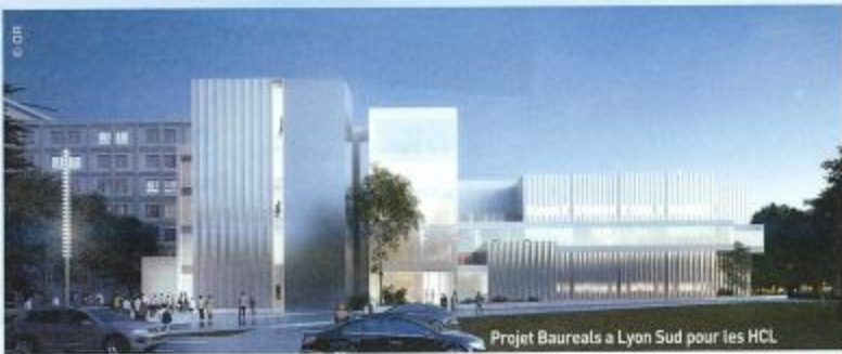
Projet Baureals à Lyon Sud pour les HCL